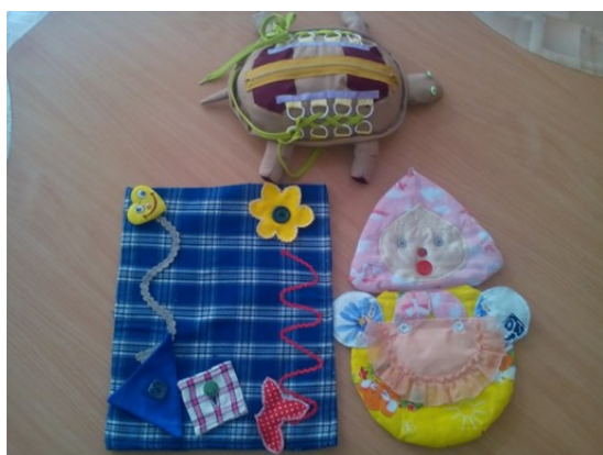
Пособие по шнуровке, застегивание пуговиц.