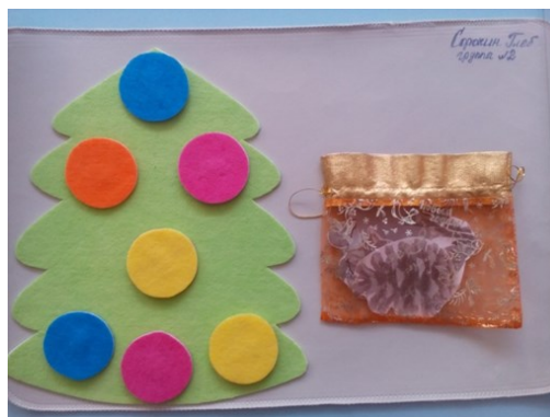
Зажги на ёлочке огни