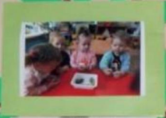
GRUPUL 4 ANI Pentru dezvoltarea coordonării motorii, organizarea mesei, pregătirea de gătit, decorarea, etc.