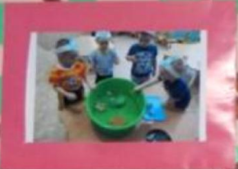
GRUPUL 4 ANI Pentru dezvoltarea coordonării motorii, organizarea mesei, pregătirea de gătit, decorarea, etc.