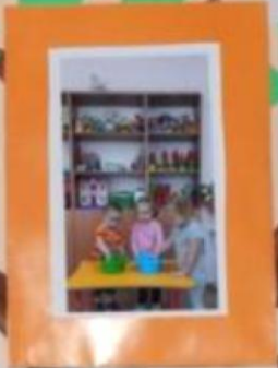
GRUPUL 4 ANI Pentru dezvoltarea coordonării motorii, organizarea mesei, pregătirea de gătit, decorarea, etc.