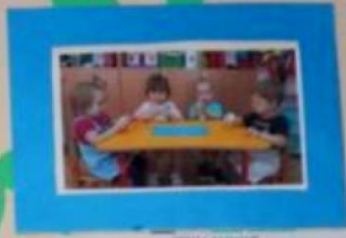
GRUPUL 4 ANI Pentru dezvoltarea coordonării motorii, organizarea mesei, pregătirea de gătit, decorarea, etc.