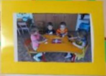
GRUPUL 4 ANI Pentru dezvoltarea coordonării motorii, organizarea mesei, pregătirea de gătit, decorarea, etc.