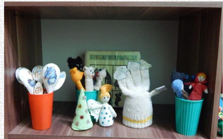
Пальчиковый театр и театр ложек